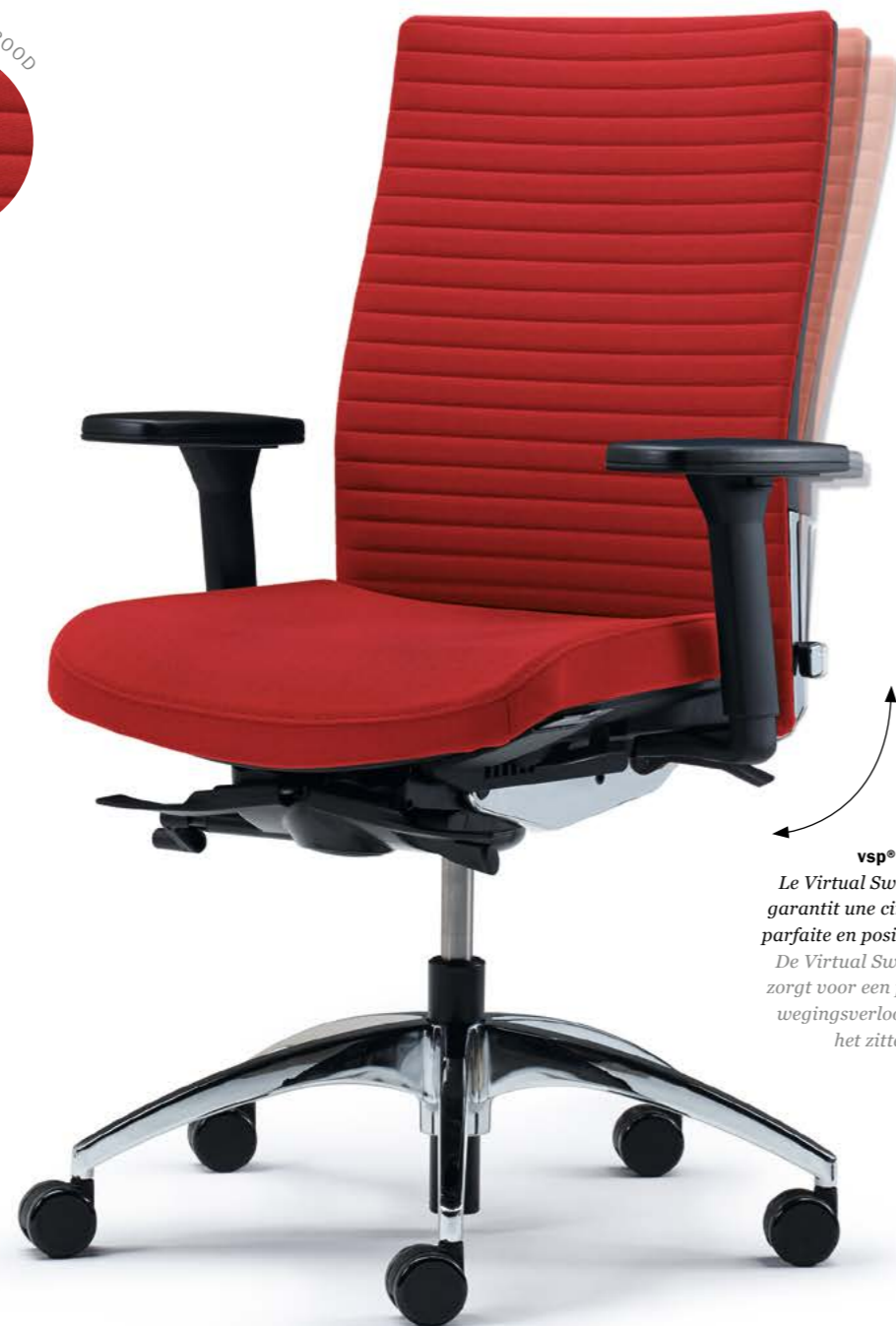
vsp® Le Virtual Swing Point garantit une cinématique parfaite en position assise. De Virtual Swing Point zorgt voor een perfect bewegingsverloop tijdens het zitten.